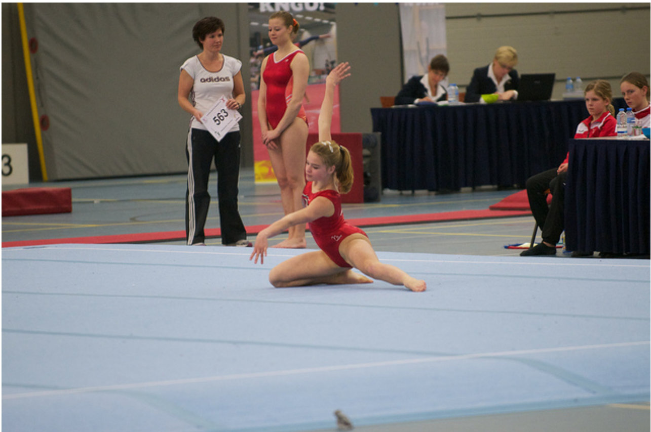
Turnerin 2012-03-24 at 16-48-42 , Gymnastiekvereniging OKK..., CC BY-NC-ND 2.0, 09.01.2014

2. Der Kraftsinn beschreibt den Spannungszustand der Muskeln und der Sehnen.