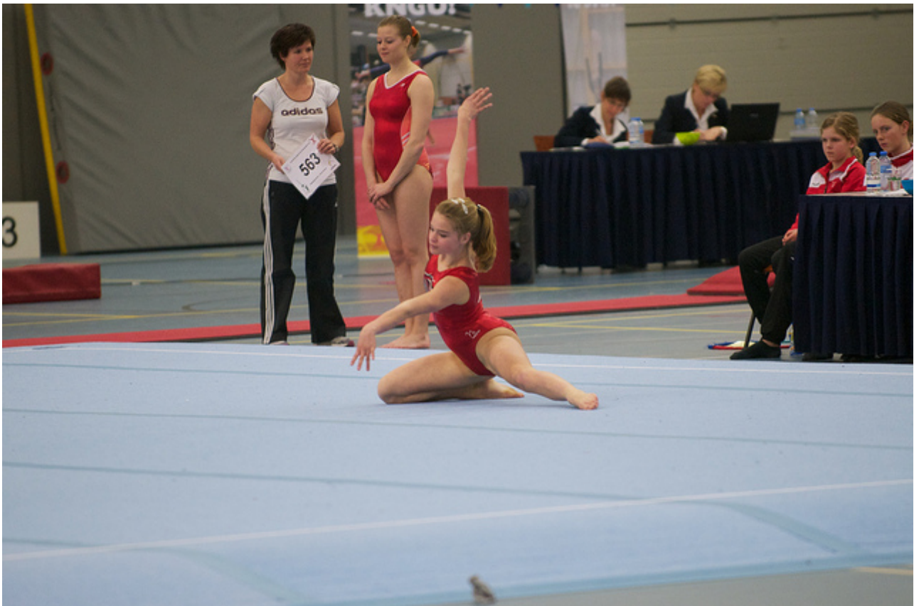
2012-03-24 at 16-48-42 , Gymnastiekvereniging OKK..., CC BY-NC-ND 2.0, 09.01.2014

2. Der Kraftsinn beschreibt den Spannungszustand der Muskeln und der Sehnen.