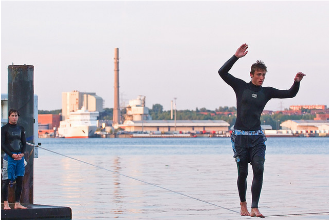
Slackline, 09.01.2014

2. Der Kraftsinn beschreibt den Spannungszustand der Muskeln und der Sehnen.