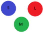
Abb. 1 Alle Zapfentypen

Normalerweise sieht ein Mensch durch bestimmte Sinneszellen, die sogenannten Zapfen, farbig. Es gibt drei verschiedene Sorten von Zapfen im Auge: Rot-, Grün- und Blauzapfen (L-, M- und S-Zapfen genannt). L-Zapfen (L für Long) sprechen auf längere Wellenlängen an, M-Zapfen (M für Medium) auf mittlere Wellenlängen und S-Zapfen (S für Short) auf kürzere. Jede dieser drei Sorten reagiert auf einen eigenen Farbbereich empfindlich – entweder Rot, Grün oder Blau. Werden die Zapfen durch Licht einer bestimmten Wellenlänge angeregt , wandeln sie diesen Reiz in elektrische Impulse um. Diese gelangen in das Gehirn, wo die eigentliche Farbempfindung stattfindet. Doch bei manchen Menschen ist dieser Vorgang verhindert . Dies kann verschiedene Ursachen haben, die im folgendem genannt werden.