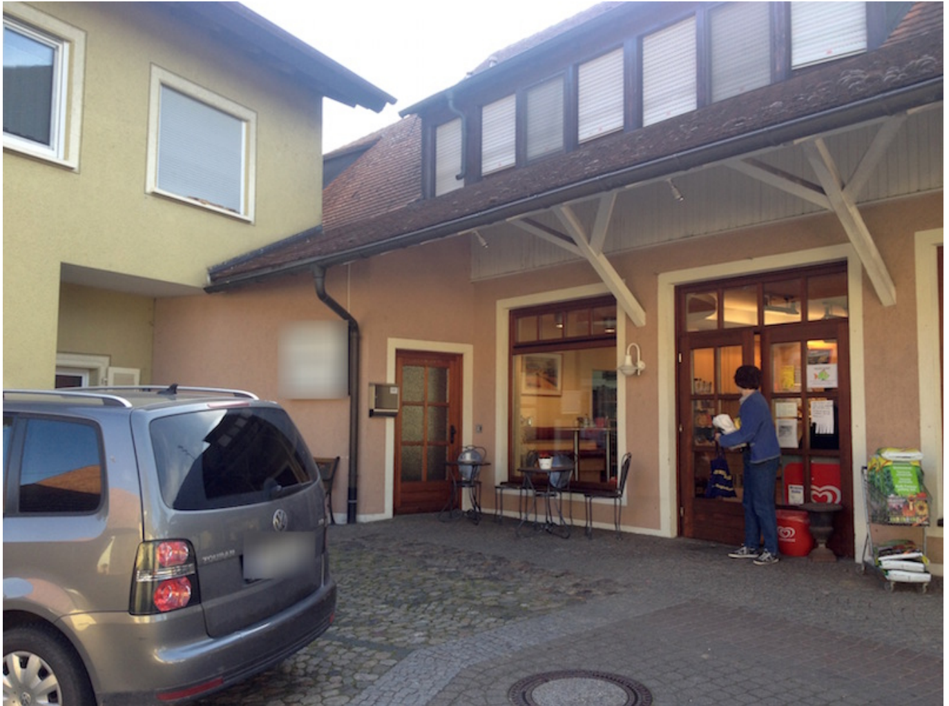
Abb. 3: Gesamtansicht, die oben dargestellten Detailansichten befinden sich zwischen dem geparkten Auto und der Sitzgruppe vor dem Fenster.

nwt , naturwissenschaft , kritisches-denken