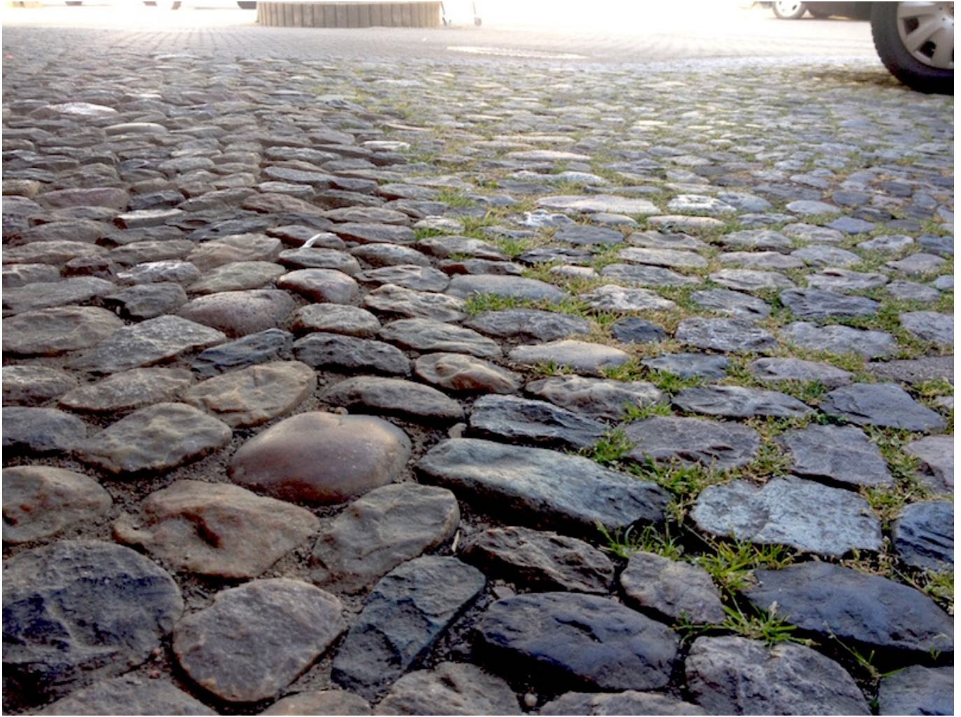
Abb. 2: Detailaufnahme der Grenzlinie zwischen mit Gras bewachsenen und kahlen Pflasterfugen, schräger Blickwinkel