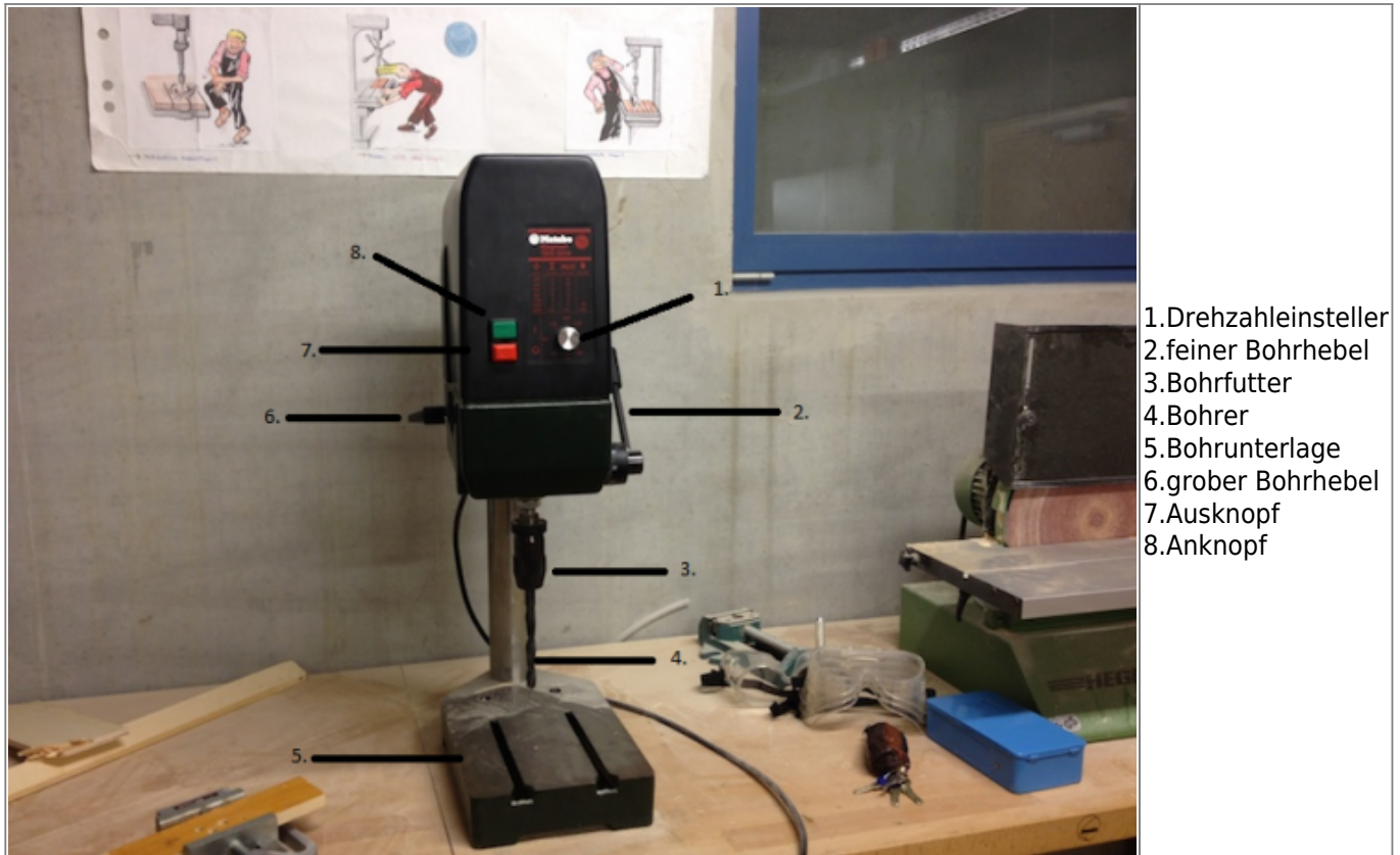
Abbildung von der Standbohrmaschine