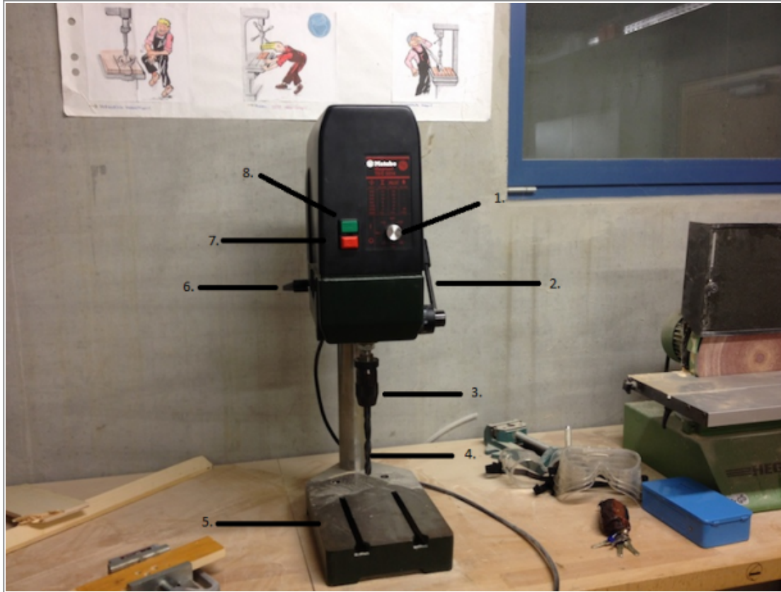
Abbildung von der Standbohrmaschine