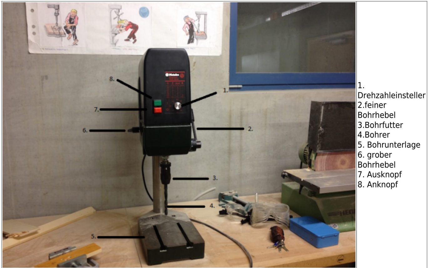
Abbildung von der Standbohrmaschine