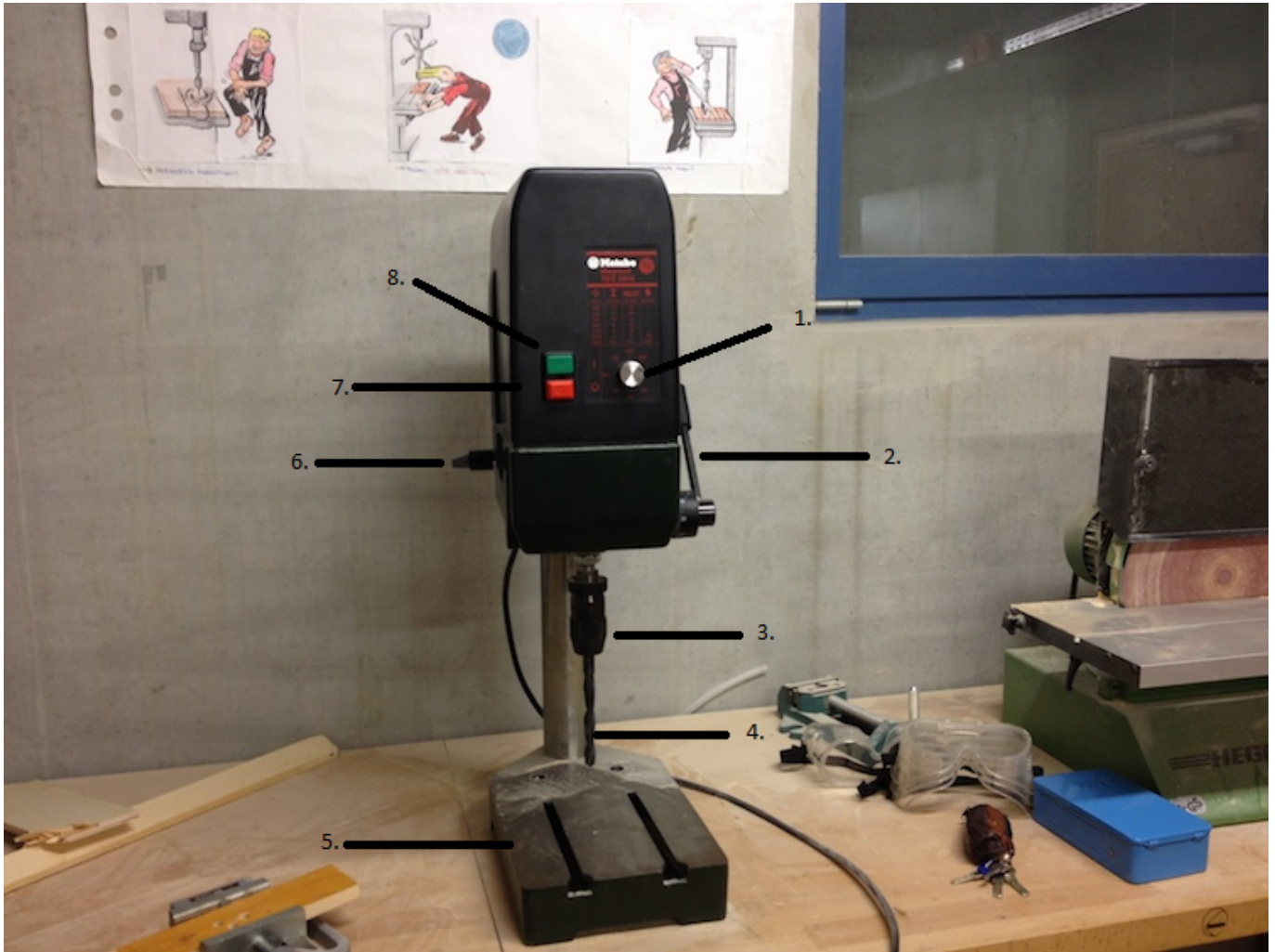
Abbildung von der Standbohrmaschine