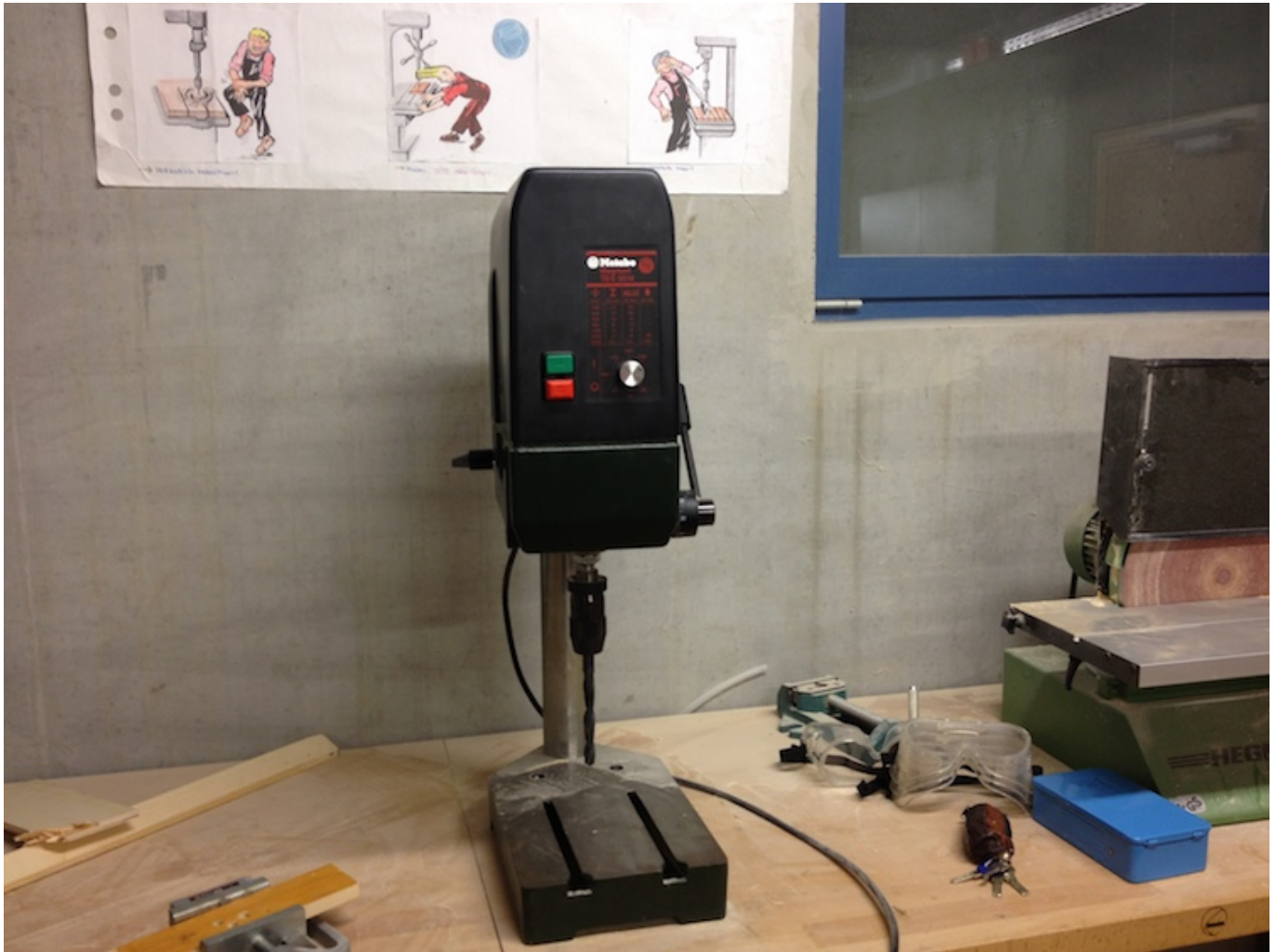
Abbildung von der Standbohrmaschine