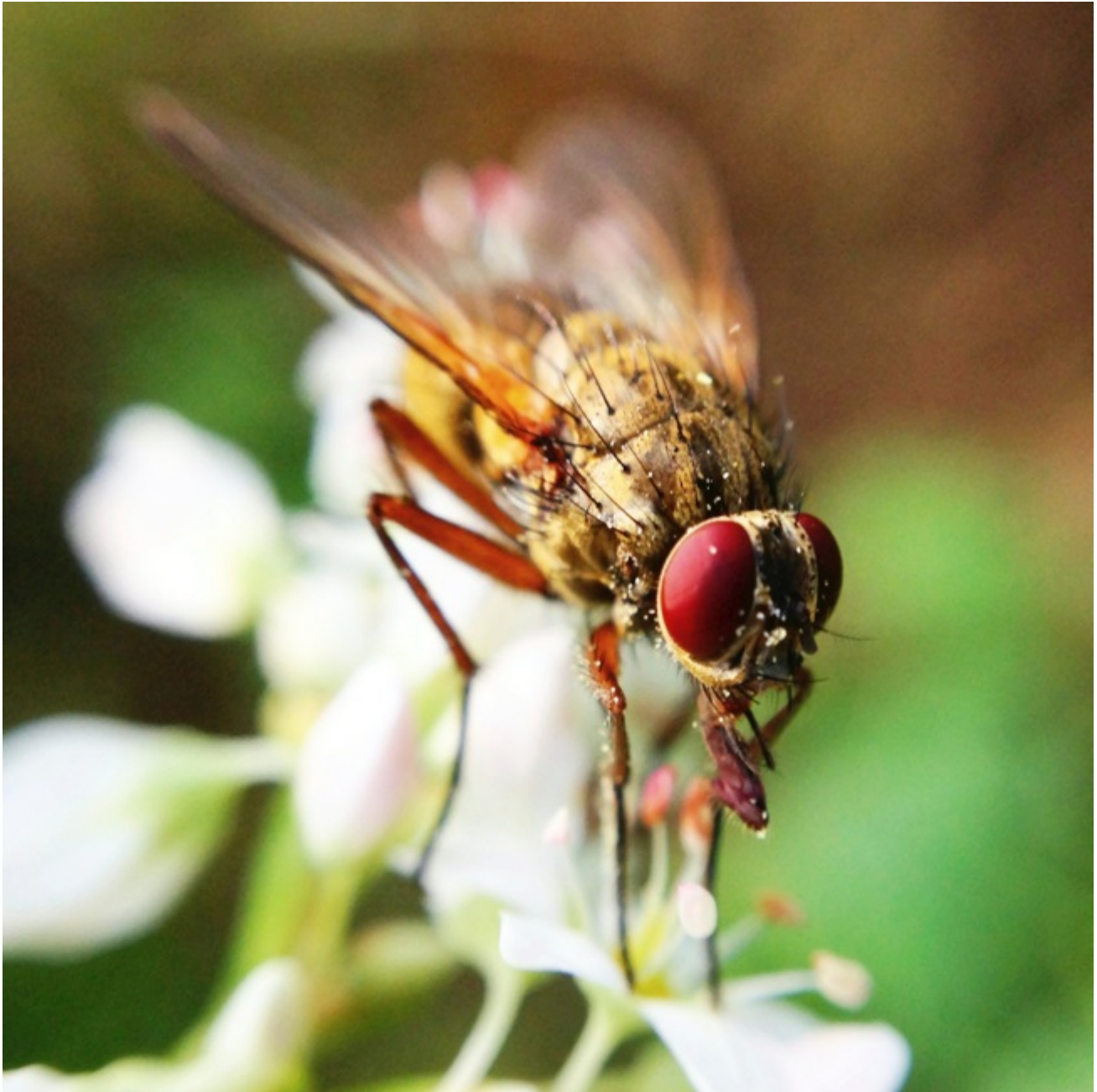
Foto: Andreas Kalt faszinierende-naturwissenschaft , naturwissenschaft