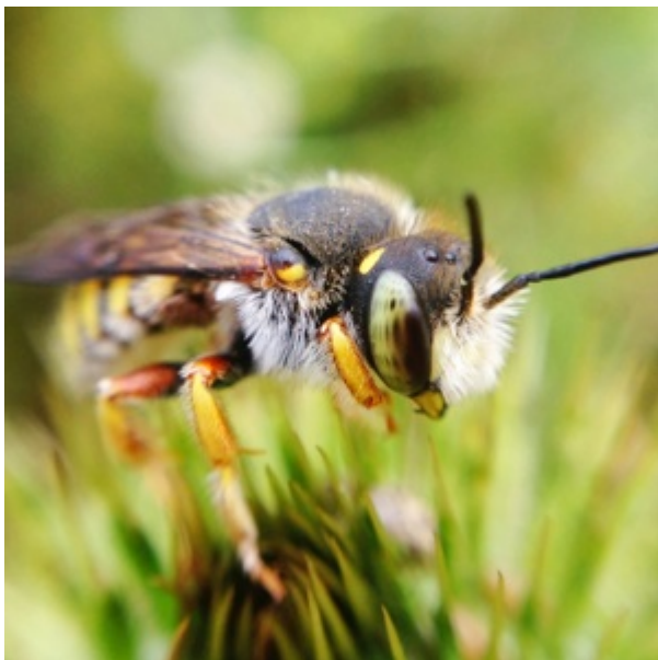
Schönheit der Natur auf vielen Ebenen

Eine Raumsonde machte vor über 20 Jahren aus 6,4 Milliarden Kilometern Entfernung ein Foto der Erde. Es kann unser Verständnis der Welt vertiefen und uns zum Nachdenken anregen.