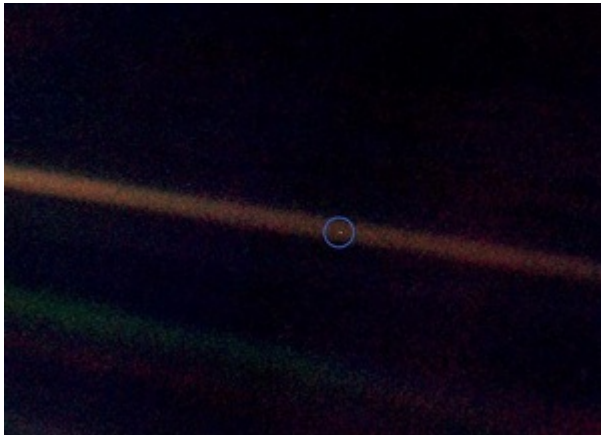
The pale blue dot – Der blaue Punkt im All

Man muss kein Wissenschaftler sein, um die Welt um sich herum mit offenen Augen zu erkunden: Wissenschaftliches Denken im Alltag anwenden