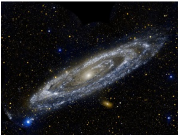
Die erstaunlichste Tatsache über das Universum

Richard Dawkins schaut sich ein alltägliches Brombeerblatt an und erklärt, warum es eine faszinierende Miniaturfabrik ist und warum alle Pflanzen mit uns verwandt sind.