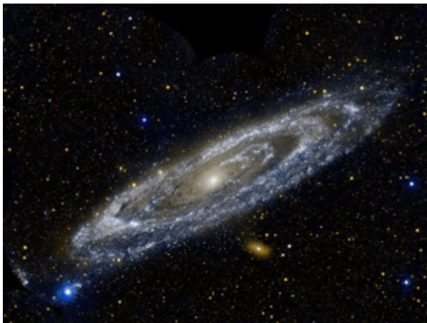
Die erstaunlichste Tatsache über das Universum

Richard Dawkins schaut sich ein alltägliches Brombeerblatt an und erklärt, warum es eine faszinierende Miniaturfabrik ist und warum alle Pflanzen mit uns verwandt sind.