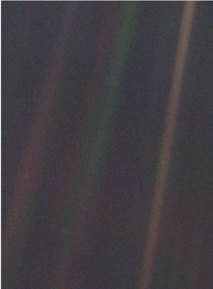
Foto der Erde, das von der Raumsonde Voyager 1 aus ca. 6,4 Milliarden Kilometern Entfernung aufgenommen wurde. Die Erde ist der winzige helle Punkt in der Mitte der orangenen Linie rechts. Sie nimmt auf dem Bild ca. 0,12 % eines Bildpunkts (Pixel) ein. Die Linien sind Reflexionen von Sonnenlicht auf der Optik der Kamera.