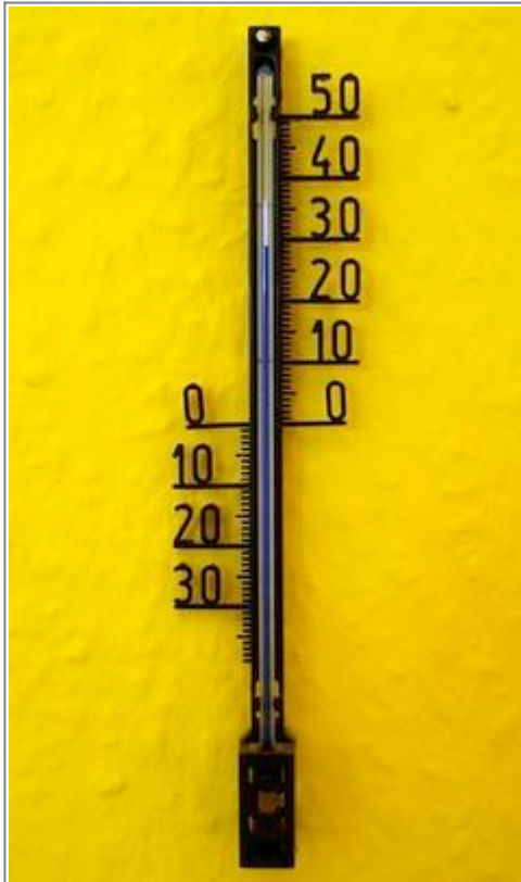
Abb. 1: Im Haushalt gebräuchliches Flüssigkeitsthermometer. In dem Gehäuse befindet sich ein Glasrohr, in dem eine gefärbte Flüssigkeit aufsteigen kann.

Eine typische Thermometerflüssigkeit ist Quecksilber . Da es aber ein sehr giftiges Metall ist, benutzt man heute meist Alkohol für die Thermometer, die wir im Alltag benutzen.