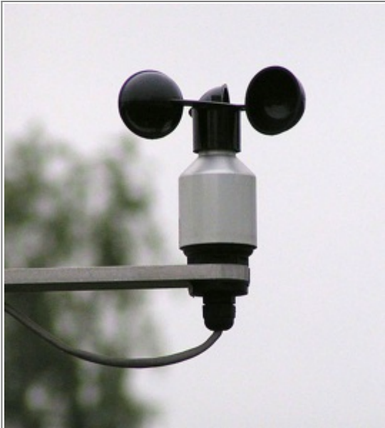
Abb. 6: Anemometer, ein Messgerät für die Windgeschwindigkeit