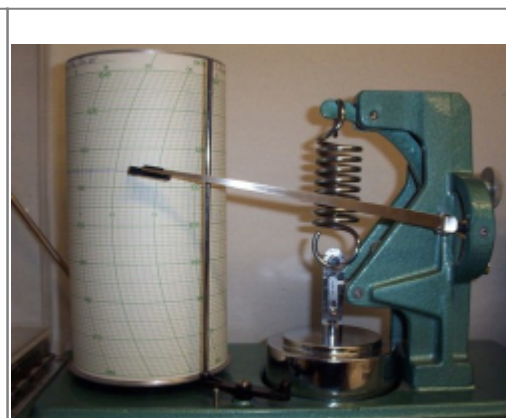
Abb. 4: Barograph