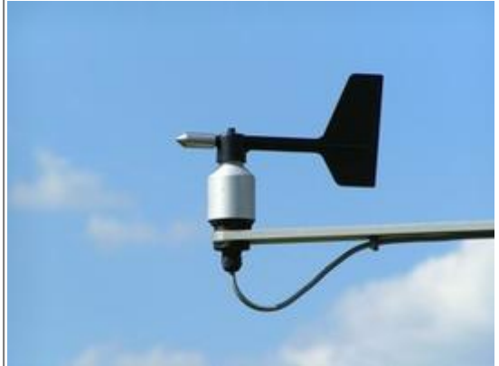
Abb. 7: Windfahne (= Windrichtungsgeber)