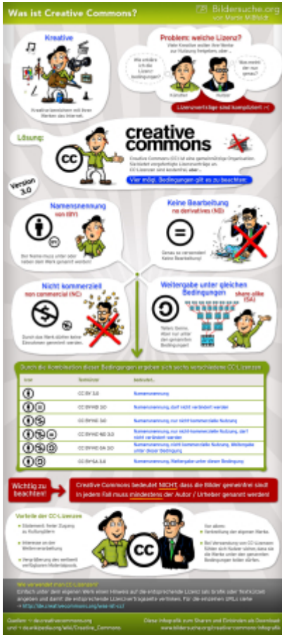
Infografik von Martin Mißfeldt , CC BY-SA.