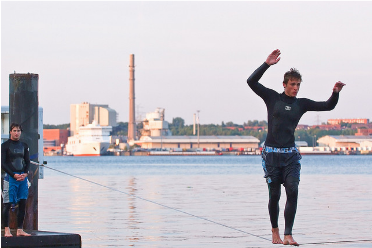
Balancierende Person auf einer Slackline

Slackline , Arne List, CC BY-SA 2.0, 09.01.2014