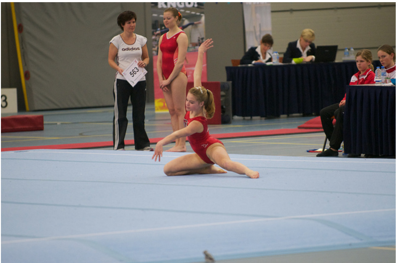
2012-03-24 at 16-48-42, Gymnastiekvereniging OKK..., 09.01.2014

2. Der Kraftsinn beschreibt den Spannungszustand der Muskeln und der Sehnen.