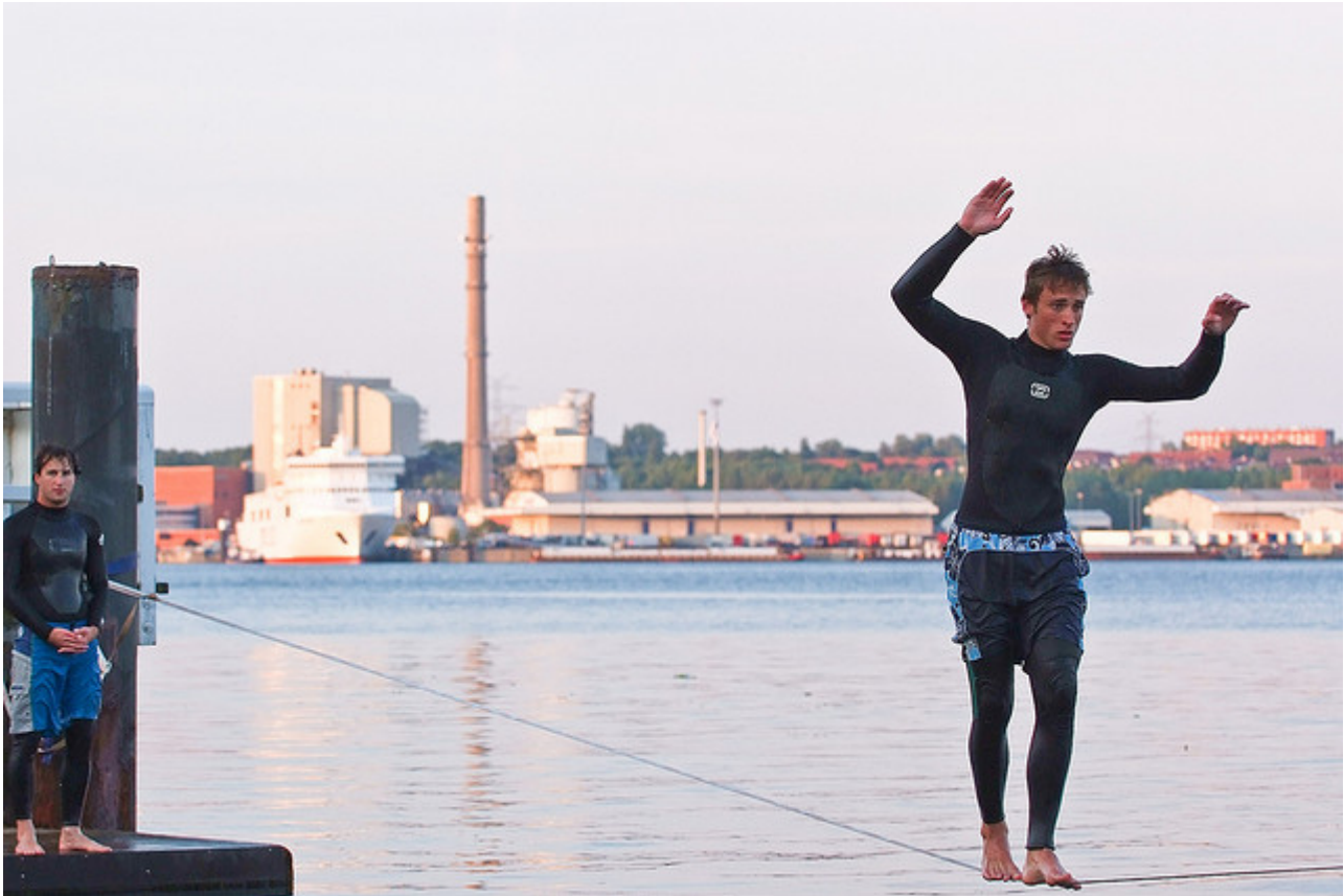
Slackline

2. Der Kraftsinn beschreibt den Spannungszustand der Muskeln und der Sehnen.