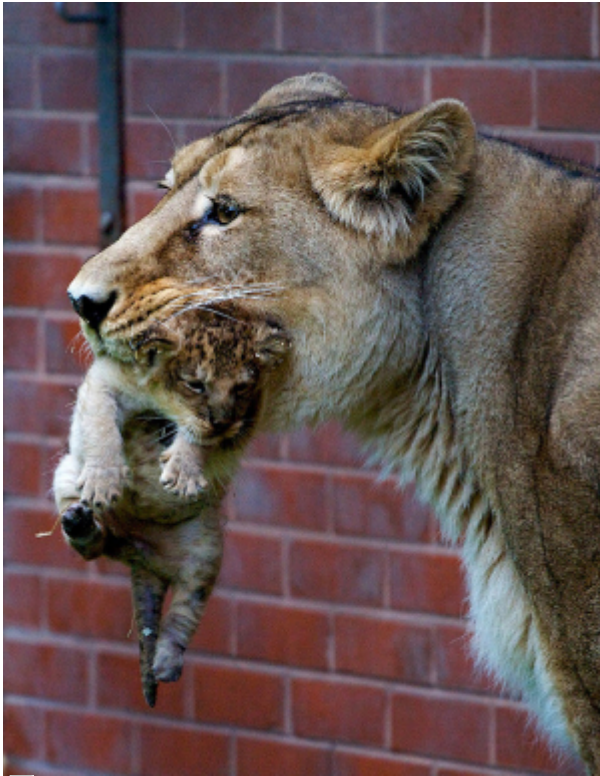
Löwin hält ihr Junges im Maul

Körpers, welche wir unbewusst steuern und kontrollieren können.