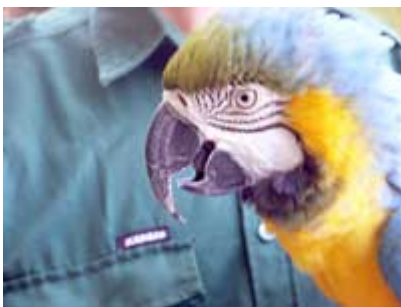
Sicht ohne grauen Star , Marcela, 04.01.14

Der graue Star bezeichnet die Eintrübung der durchsichtigen Augenlinse. Die Sehstärke lässt langsam nach, wobei das zur totalen Erblindung führen kann, wenn man nicht operativ eingreifen lässt.