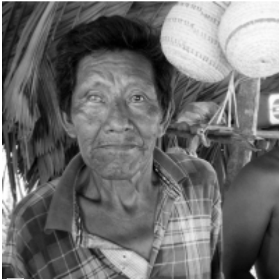
Blind Eye

Es gibt viele verschiedene Gründe, die zur Erblindung führen. Die häufigsten Ursachen werden in unterschiedliche Kategorien unterteilt: