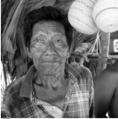
Blind Eye

Es gibt viele verschiedene Gründe, die zur Erblindung führen. Die häufigsten Ursachen werden in unterschiedliche Kategorien unterteilt: