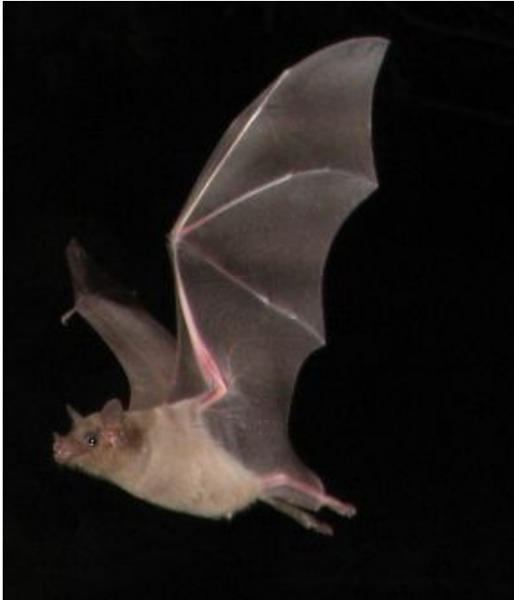
Fledermaus bei Nacht

Fledermäuse sind Säugetiere, die nahezu auf der ganzen Welt verbreitet sind. Sie sind sehr unterschiedlich groß. Es gibt Arten die sehr klein sind, wie z.B. die Hummelfledermaus (das kleinste bisher bekannte Säugetier) mit einer Spannweite von 12cm, einem Gewicht von 2g und einer Länge von 3cm. Andere hingegen (wie der Riesenflughund) haben eine Spannweite von 170cm, ein Gewicht von 1,5 kg und eine Körperlänge von 50cm. Sie haben ein seidiges, dichtes Fell ohne Haarstrich, welches meist grau bis braun oder auch schwärzlich gefärbt ist. Die Tiere ernähren sich meist von Insekten, größere Arten auch von Nagetieren, kleineren Zugvögelarten, Fischen oder Fröschen. Es gibt natürlich auch ein paar besondere Feinschmecker, welche z.B. in den Tropen ganz und gar vegetarisch leben, oder sich (wie die Vampirfledermäuse) vom Blut anderer Tiere ernähren, diese sind jedoch eher selten. Ihre natürlichen Feinde sind vor allem Raubtiere, wie Katzen, oder auch Greifvögel und Eulen.