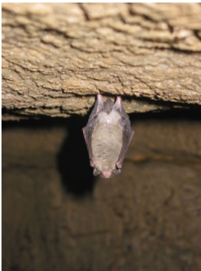
Fledermaus in einer Höhle

Früher hat man geglaubt, dass Fledermäuse (wie andere nachtaktive Tiere) besonders gute Augen hätten, um sich in der Dunkelheit zurechtzufinden. Da die Fledermäuse jedoch in Höhlen leben, wo es nochmals dunkler ist als normalerweise bei Nacht, vermutete man, dass die Tiere noch einen anderen, spezielleren Weg gefunden hätten, sich zu orientieren.