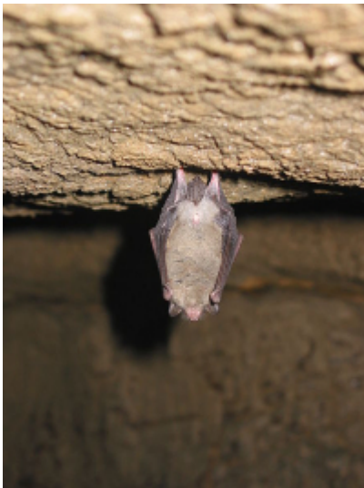
Fledermaus in einer Höhle

Früher hat man geglaubt, dass Fledermäuse (wie andere nachtaktive Tiere) besonders gute Augen hätten, um sich in der Dunkelheit zurechtzufinden. Da die Fledermäuse jedoch in Höhlen leben, wo es nochmals dunkler ist als normalerweise bei Nacht, vermutete man, dass die Tiere noch einen anderen, spezielleren Weg gefunden hätten, sich zu orientieren.