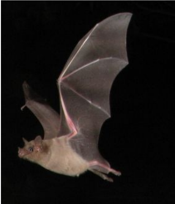
Fledermaus bei Nacht, 12.12.2013

Fledermäuse sind Säugetiere, die nahezu auf der ganzen Welt verbreitet sind. Sie sind sehr unterschiedlich groß. Es gibt Arten (wie das kleinste bisher bekannte Säugetier, die Hummelfledermaus mit einer Spannweite von 12cm, einem Gewicht von 2g und einer Länge von 3cm. Andere hingegen (wie der Riesenflughund) haben eine Spannweite von 170cm, ein Gewicht von 1,5 kg und eine Körperlänge von 50cm. Sie haben ein seidiges, dichtes Fell ohne Haarstrich, welches meist grau bis braun oder auch schwärzlich gefärbt ist. Die Tiere ernähren sich meist von Insekten, größere Arten auch von Nagetieren, kleineren Zugvögelarten, Fischen oder Fröschen. Es gibt natürlich auch ein paar besondere Feinschmecker, welche z.B. in den Tropen ganz und gar vegetarisch leben, oder sich (wie die Vampirfledermäuse) vom Blut anderer Tiere ernähren, diese sind jedoch eher selten. Ihre natürlichen Feinde sind vor allem Raubtiere, wie Katzen, oder auch Greifvögel und Eulen.