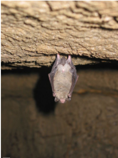
Fledermaus in einer Höhle, 30.12.2013

Früher hat man geglaubt, dass Fledermäuse (wie andere nachtaktive Tiere) besonders gute Augen hätten, um sich in der Dunkelheit zurechtzufinden. Da die Fledermäuse jedoch in Höhlen leben, wo es nochmals dunkler ist als normalerweise bei Nacht, vermutete man, dass die Tiere noch einen anderen, spezielleren Weg gefunden hätten, sich zu orientieren.