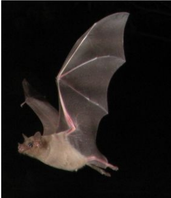
Fledermaus bei Nacht, 12.12.2013

Fledermäuse sind Säugetiere, die nahezu auf der ganzen Welt verbreitet sind. Sie sind sehr unterschiedlich groß. Es gibt Arten (wie das kleinste bisher bekannte Säugetier, die Hummelfledermaus mit einer Spannweite von 12cm, einem Gewicht von 2g und einer Länge von 3cm. Andere hingegen (wie der Riesenflughund) haben eine Spannweite von 170cm, ein Gewicht von 1,5 kg und eine Körperlänge von 50cm. Sie haben ein seidiges, dichtes Fell ohne Haarstrich, welches meist grau bis braun oder auch schwärzlich gefärbt ist. Die Tiere ernähren sich meist von Insekten, größere Arten auch von Nagetieren, kleineren Zugvögelarten, Fischen oder Fröschen. Es gibt natürlich auch ein paar besondere Feinschmecker, welche z.B. in den Tropen ganz und gar vegetarisch leben, oder sich (wie die Vampirfledermäuse) vom Blut anderer Tiere ernähren, diese sind jedoch eher selten. Ihre natürlichen Feinde sind vor allem Raubtiere, wie Katzen, oder auch Greifvögel und Eulen.