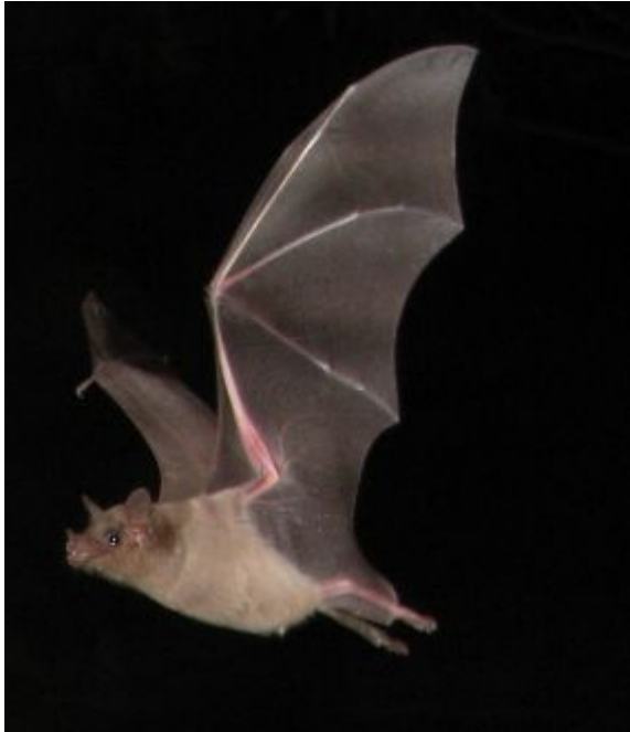
Fledermaus bei Nacht, 12.12.2013

Fledermäuse sind Säugetiere, die nahezu auf der ganzen Welt verbreitet sind. Sie wiegen durchschnittlich 200 Gramm, haben eine Spannweite von 60cm und eine Kopfrumpflänge von 14cm. Sie haben ein seidiges, dichtes Fell ohne Haarstrich, welches meist grau bis braun oder auch schwärzlich gefärbt ist. Die Tiere ernähren sich meist von Insekten, größere Arten auch von Nagetieren, kleineren Zugvögelarten, Fischen oder Fröschen. Wenige Arten, die z.B. in den Tropen ganz und gar vegetarisch leben, oder sich (wie die Vampirfledermäuse) vom Blut anderer Tiere ernähren, sind selten. Ihre natürlichen Feinde sind vor allem Raubtiere, wie Katzen, oder auch Greifvögel und Eulen.