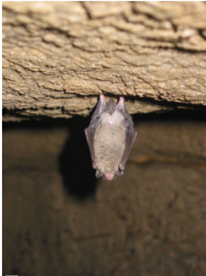
Fledermaus in einer Höhle

Früher hat man geglaubt, dass Fledermäuse (wie andere nachtaktive Tiere) besonders gute Augen hätten, um sich in der Dunkelheit zurechtzufinden. Da die Fledermäuse jedoch in Höhlen leben, wo es nochmals dunkler ist als normalerweise bei Nacht, vermutete man, dass die Tiere noch einen anderen, spezielleren Weg gefunden hätten, sich zu orientieren.