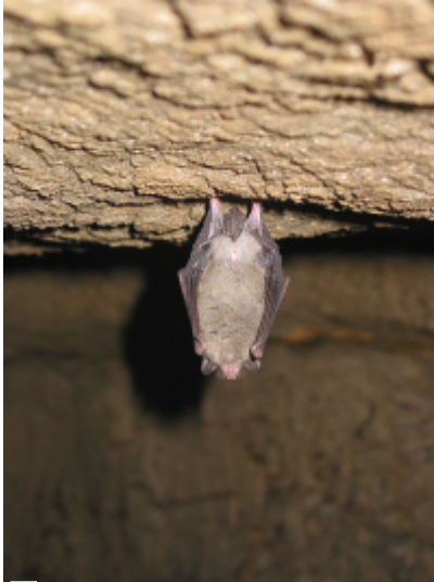
Fledermaus in einer Höhle

Früher hat man geglaubt, dass Fledermäuse (wie andere nachtaktive Tiere) besonders gute Augen hätten, um sich in der Dunkelheit zurechtzufinden. Da die Fledermäuse jedoch in Höhlen leben, wo es nochmals dunkler ist als normalerweise bei Nacht, vermutete man, dass die Tiere noch einen anderen, spezielleren Weg gefunden hätten, sich zu orientieren.