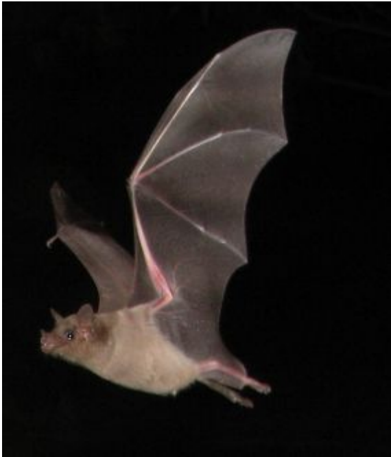
Fledermaus bei Nacht, 12.12.2013

Da Fledermäuse nachaktiv sind, müssen sie sich auch in völliger Dunkelheit orientieren können. Sie müssen Hindernissen ausweichen und Beute aufspüren können. Zudem schlafen sie tagsüber in Höhlen. Bei Nacht, wenn sie aufwachen, ist es dort noch dunkler als im Freien, da es dort keinerlei Lichtquellen gibt.