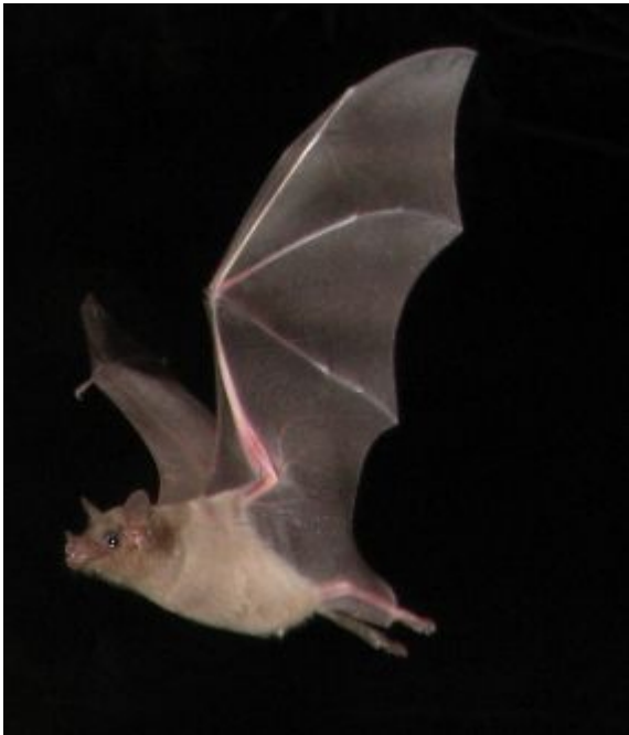
Fledermaus bei Nacht, 12.12.2013

Da Fledermäuse nachaktiv sind, müssen sie sich auch in völliger Dunkelheit orientieren können. Sie müssen Hindernissen ausweichen und Beute aufspüren können. Zudem schlafen sie tagsüber in Höhlen. Bei Nacht, wenn sie aufwachen, ist es dort noch dunkler als im Freien, da es dort keinerlei Lichtquellen gibt.