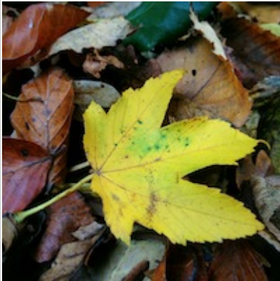
Abb. 2: Foto mit einer Bildgröße von 200 x 200 px in Originalgröße