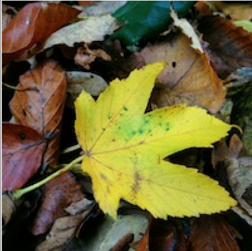
Abb. 3: Foto mit einer Bildgröße von 200 x 200 px auf eine dargestellte Größe von 400 x 400 px »aufgebläht«. Die Farbinformation der zusätzlich dargestellten Pixel muss basierend auf deren Nachbarpixeln »geraten« oder vorhandene Pixel vergrößert angezeigt werden. Dadurch leidet die Darstellungsqualität, das Foto wird »pixelig«.